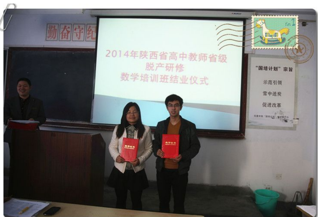
2014陕西省高中教师省级脱产研修数学班结业仪式

培训总是有限的，但开启的心智给了我广阔的天地与无穷的动力。培训是暂时的，但进取是终身的。今后，我会更积极主动地向优秀教师学习，亲身实践，把自己的收获运用到自己的教育教学中，使自己的教育教学工作得到更全面的发展。