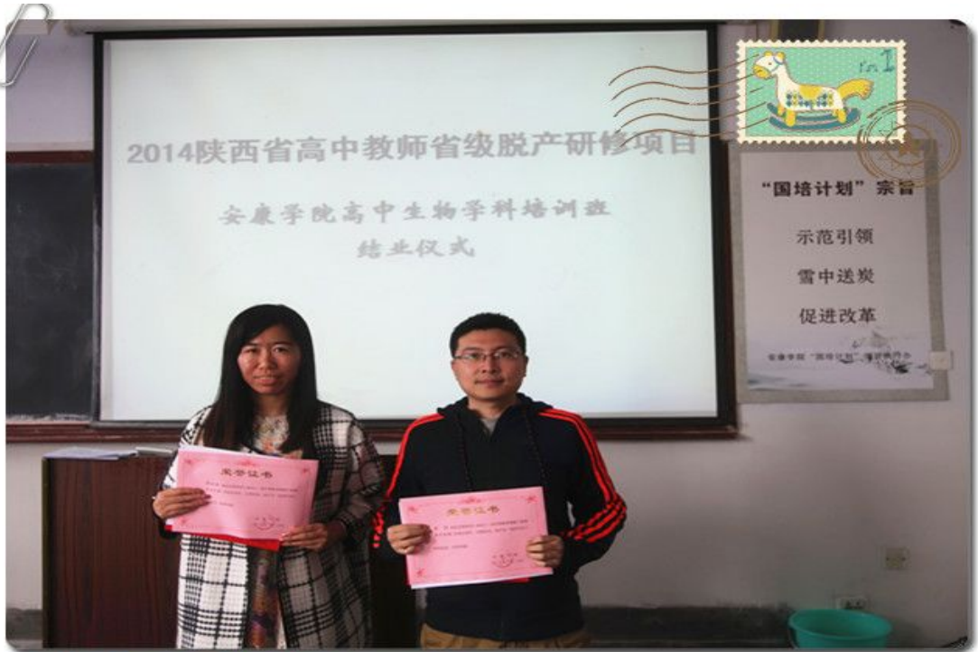
为优秀班干部颁发荣誉证书