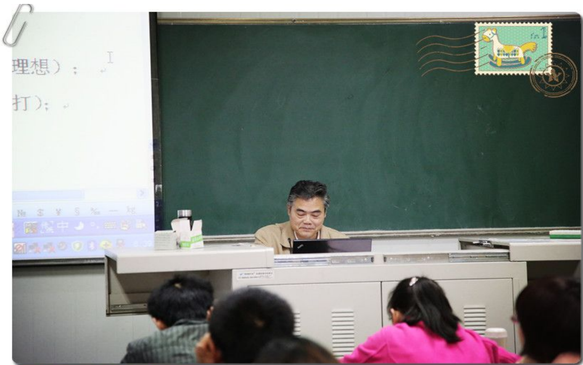
罗增儒教授给学员授课

2015年3月26日，陕西师范大学教授、博士研究生导师、国家教育部“国培计划”专家库首批专家罗增儒先生，应我校继续教育学院和数统系的邀请莅临我校为2014陕西省高中教师省级脱产研修项目高中数学学科培训班学员做了“案例分析与教师发展”专题报告，受到学员的衷心欢迎。