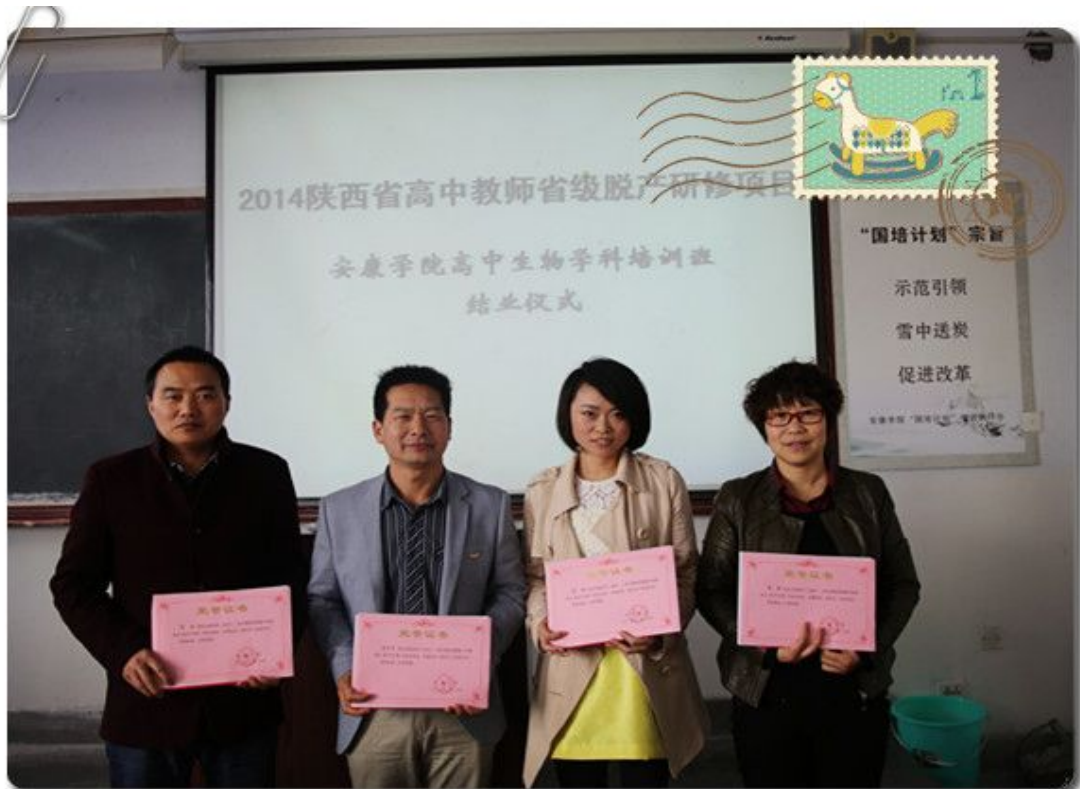
2014陕西省高中教师省级脱产研修生物班结业仪式