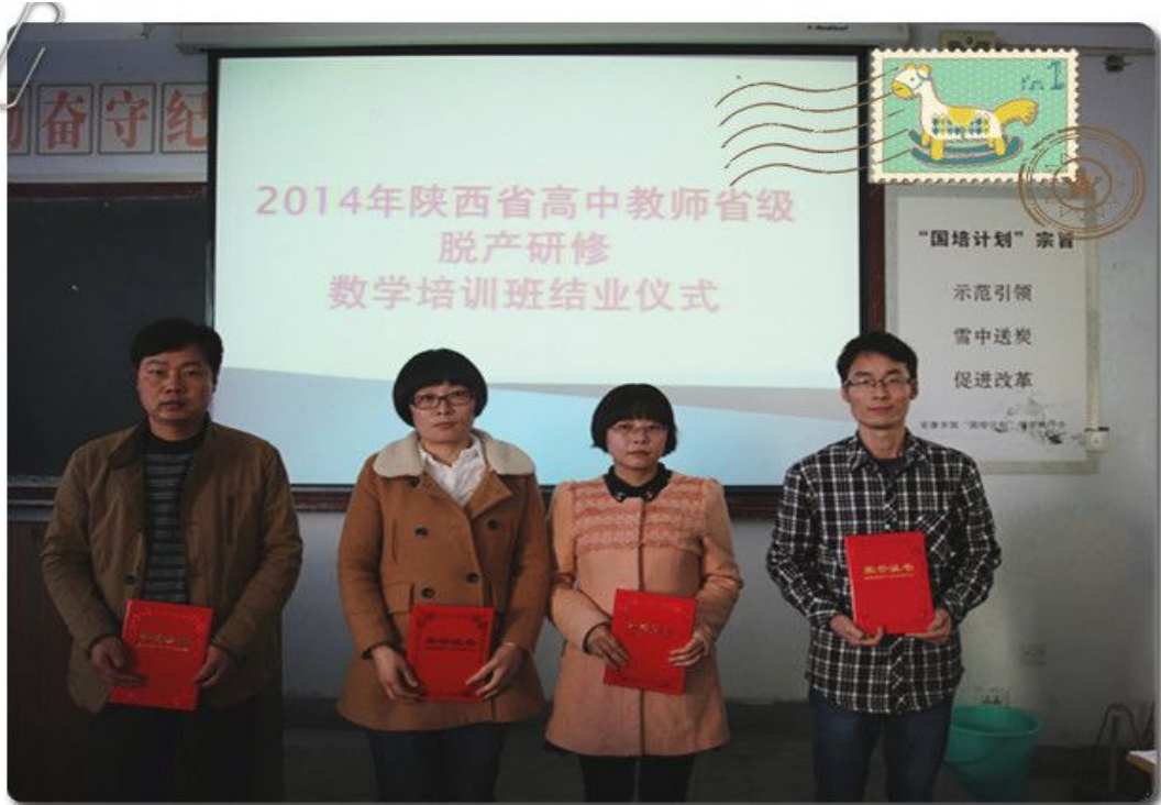
为优秀学员颁发荣誉证书